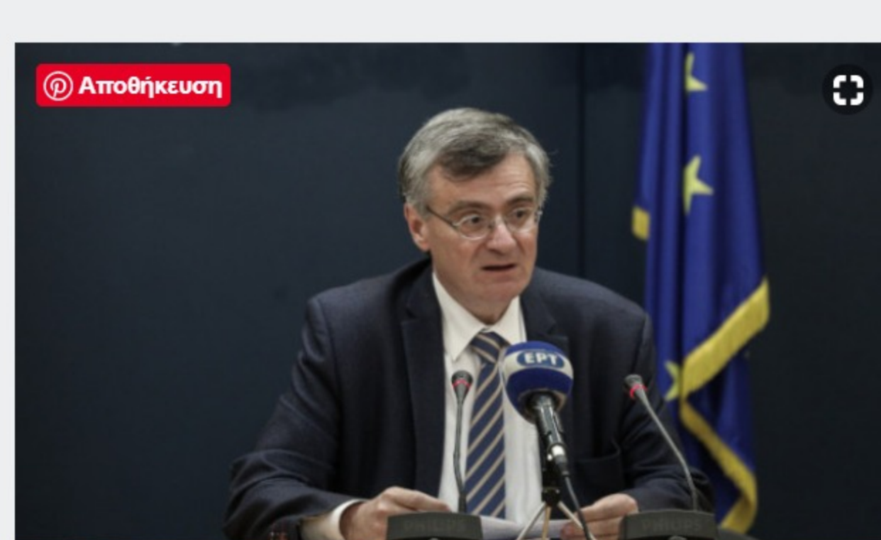
Τσιόδρας: 156 νέα κρούσματα- 5 θάνατοι