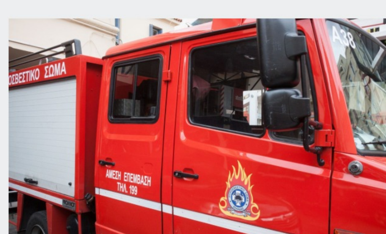
Μεγάλη φωτιά σε σκάφος στο Μικρολίμανο