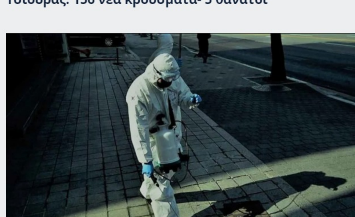
Κορωνοϊός: Έφτασαν τους 119 οι νεκροί στην Ελλάδα - Προβληματίζει η περίπτωση του 35χρονου