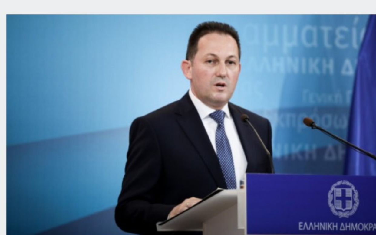
Επιστροφή στην κανονικότητα: Τι δήλωσε ο κυβερνητικός εκπρόσωπος για την άρση των μέτρων; - Ορίζοντας τα τέλη Μαΐου