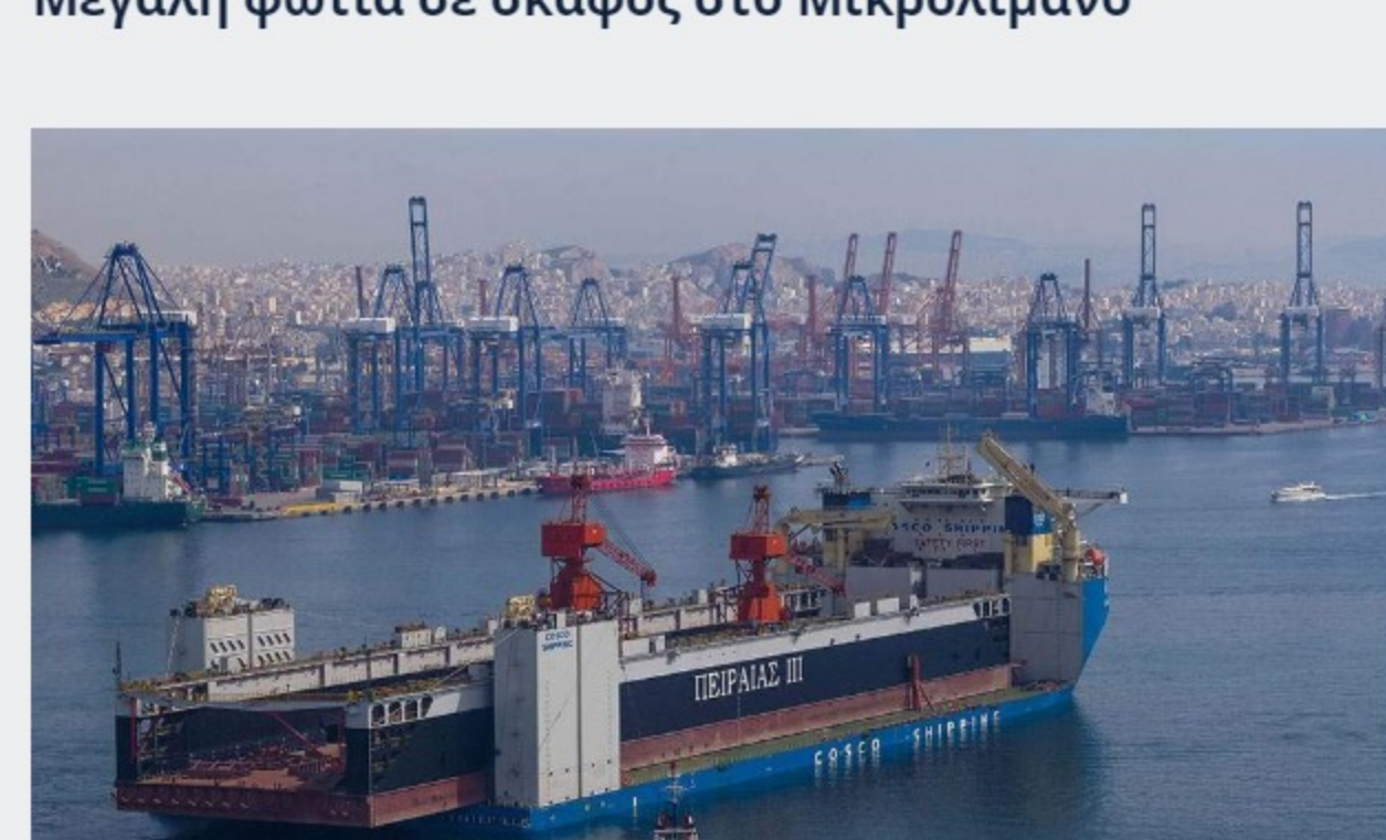
Πειραιάς: Μείωση 15% στη διακίνηση εμπορευμάτων